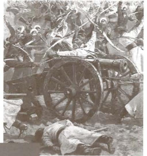
→ fragment Panoramy Atak kosynierów na rosyjskie armaty

Panoramy Raclawickiej, monumentalnego malowidła o wymiarach 120 m x 15 m, namalowanego w roku 1894 r. we Lwowie przez Jana Stykę i Wojciecha Kossaka